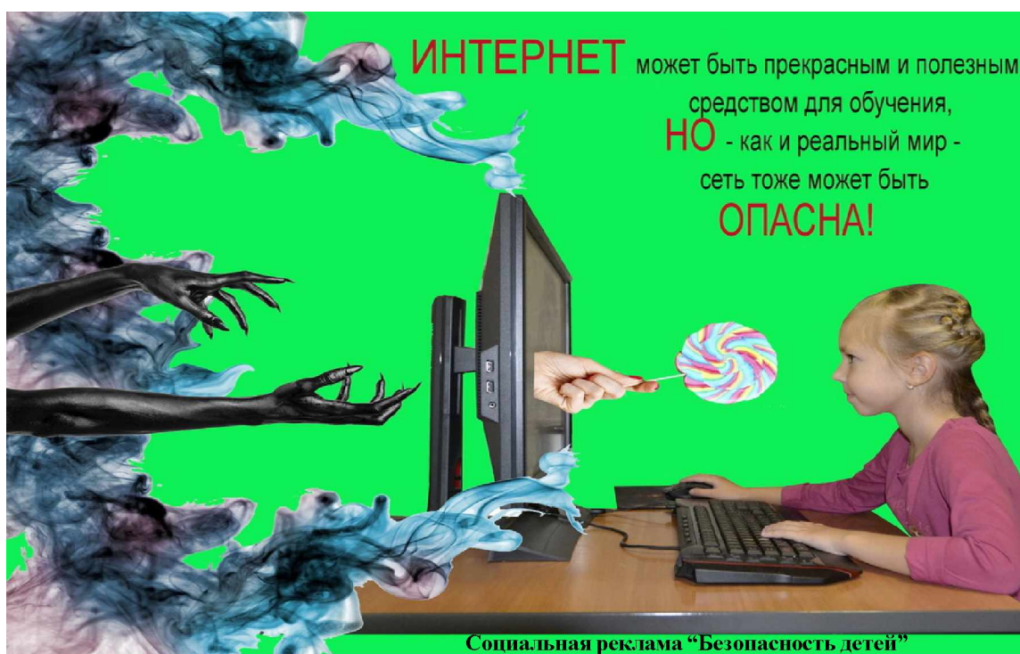
Социальная реклама «Безопасность детей»