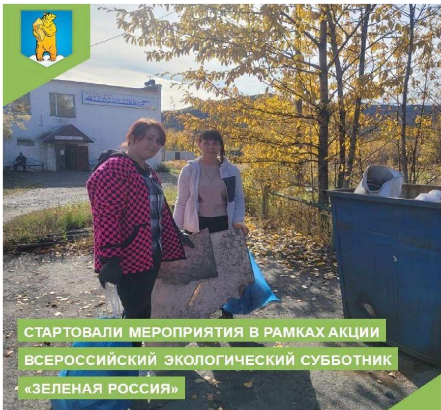
СТАРОВАЛИ МЕРОПРИЯТИЯ В РАМКАХ АКЦИИ ВСЕРОССИЙСКИЙ ЭКОЛОГИЧЕСКИЙ СУББОТНИК «ЗЕЛЕНАЯ РОССИЯ»

Субботник - это прекрасный способ проявить наше желание жить в красивом мире, всем вместе пообщаться в неофициальной обстановке на открытом воздухе в солнечный осенний день, ведь порядок должен быть как в человеке, так и вокруг него. И как приятно, проведя уборку, смотреть на мир, который стал ещё красивее благодаря нашим стараниям!