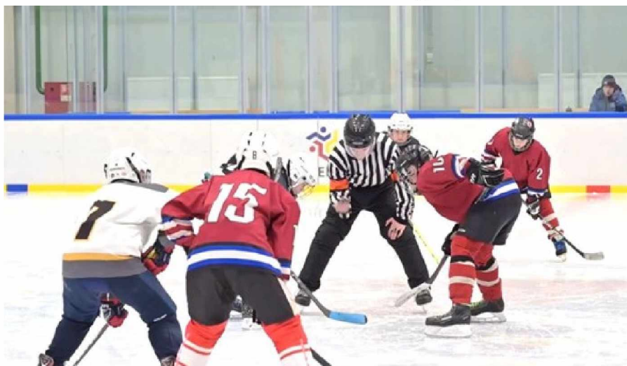
Момент игры команды КЛХ «Темп» п. Ягодное с командой г. Магадана